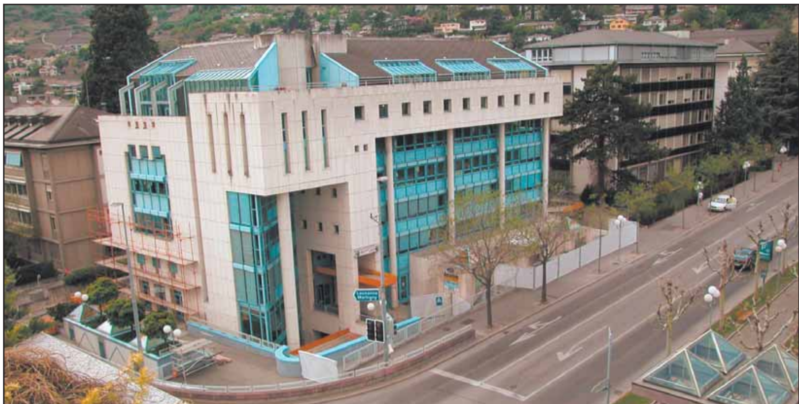
Le Service cantonal des contributions occupe ce beau bâtiment sur l'avenue de la Gare à Sion. MAMIN